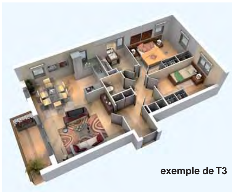
exemple de T3